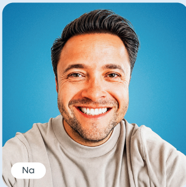
Lord Timothy Ibiza B&B vol Liefde