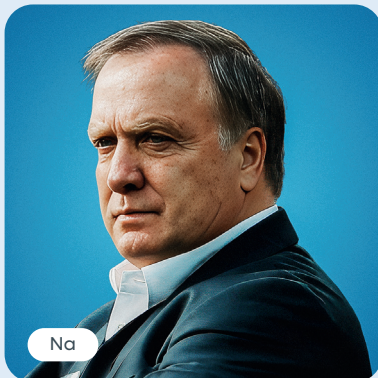
Dick Advocaat Voetbaltrainer